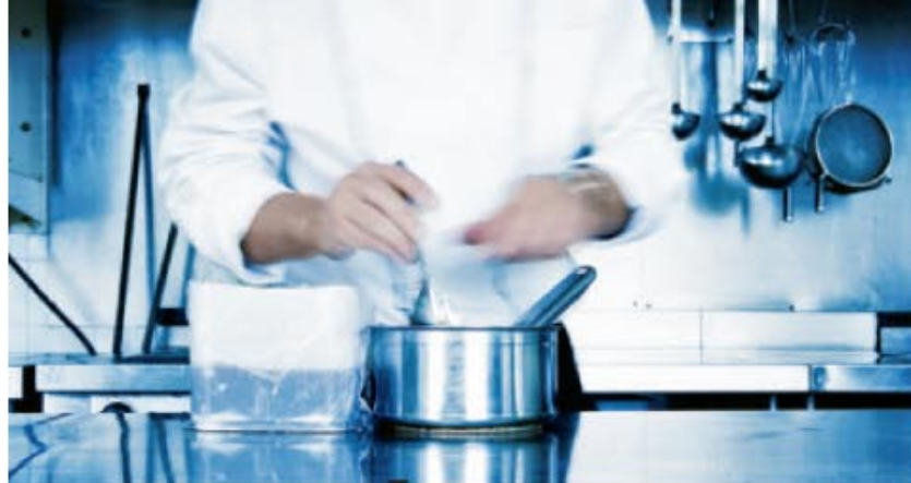
Tartare de saumon, sauce asiatique, de Solène Thouin